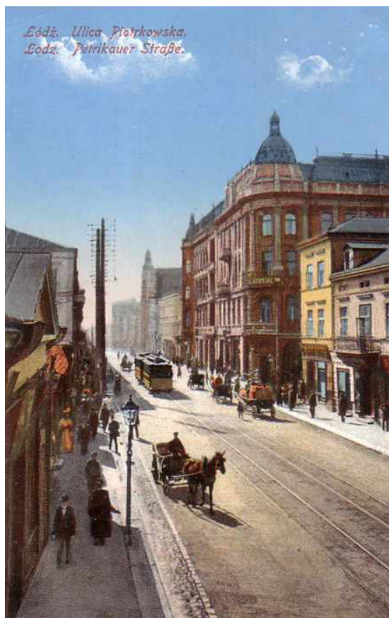
Huvudgatan Piotrkowska i Lodz i början på 1900-talet.