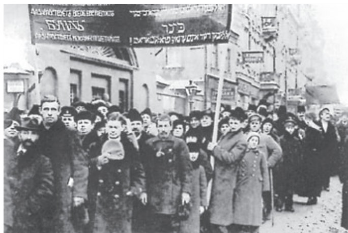
Judiska arbetare demonstrerar för bättre villkor.